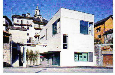
05 Raiffeisenbank Intragna: Neuinterpretation der Tessiner Bautradition