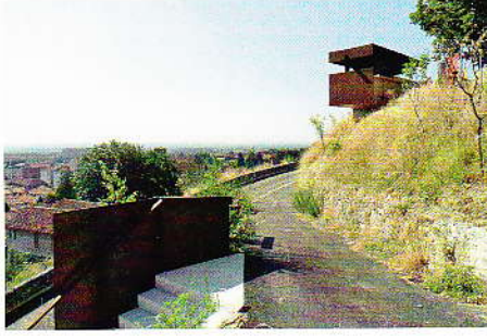
04 Aufgang Schloss Rivoli: stimmige Erschliessung aus Fragmenten