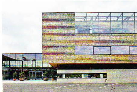
06 Bilger-Breustedt Schulzentrum: Gleichgewicht aus Raum, Funktion und Konstruktion