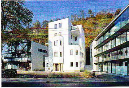
03 Alte Diakonie: einfühlsamer Städtebau in der Salzburger Altstadt