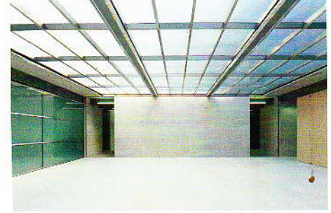
08 Palais Rothschild/Schoellerbank: zwei neue filigrane Raumschichten öffnen sich zum bestehenden Innenhof