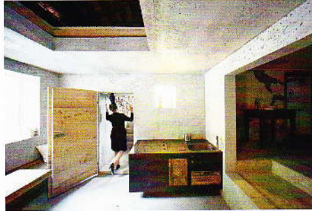
07 «Bing mich Cilli»: neue konstruktive Elemente als architektonisches Material beim Umbau des alten Bauernhauses